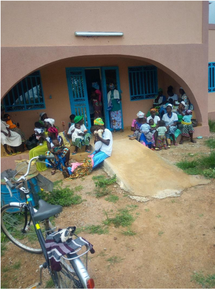
Le code sopportate con tanta pazienza dicono quanto sia apprezzato il servizio.

Intanto il Dispensario e la Maternità sono regolarmente utilizzati da tante persone.