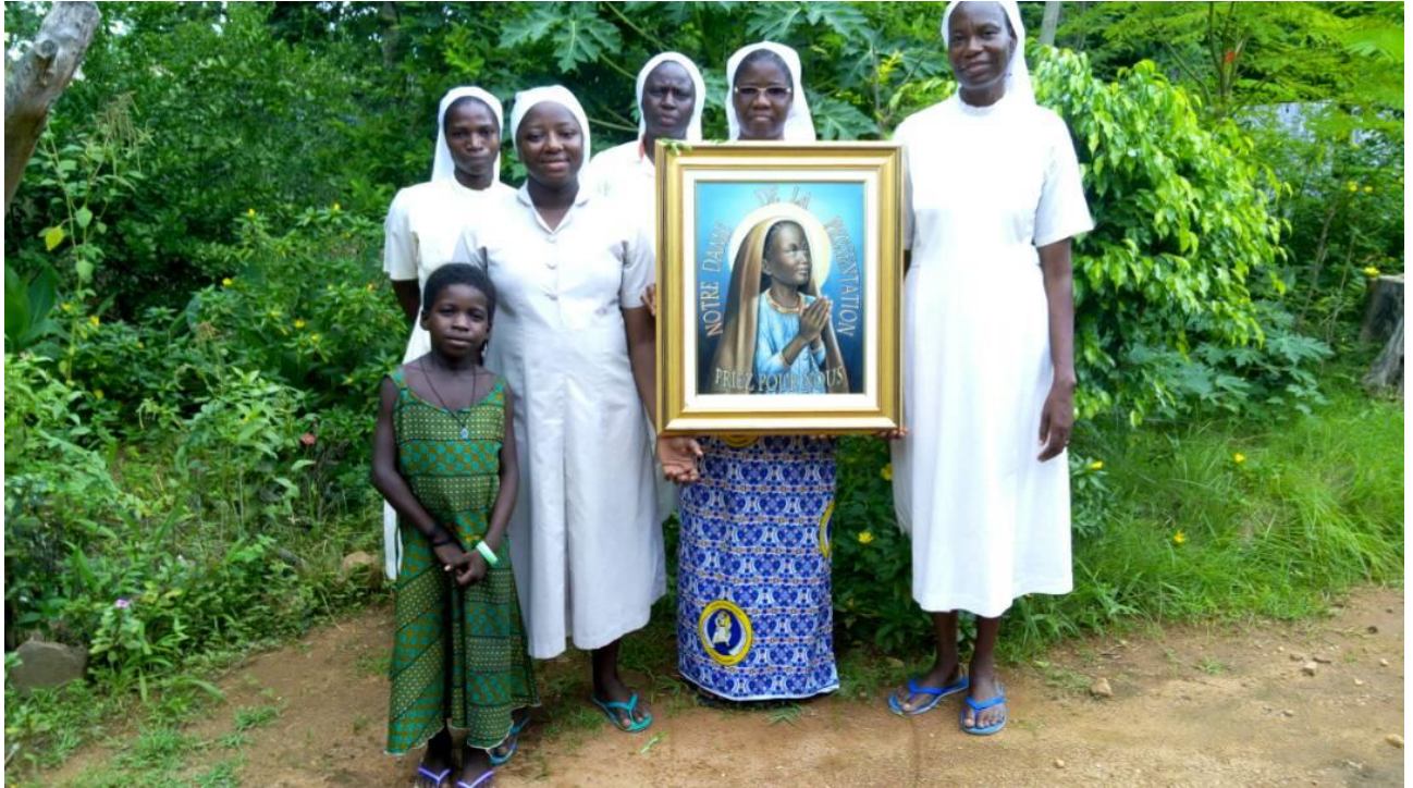
Al settimo cielo anche le Suore della congregazione di Suor Blandine, che nel container hanno trovato il quadro della loro patrona (la Beata Vergine della Presentazione al Tempio) opera del nostro pittore Cusin (a sinistra nella foto sotto).