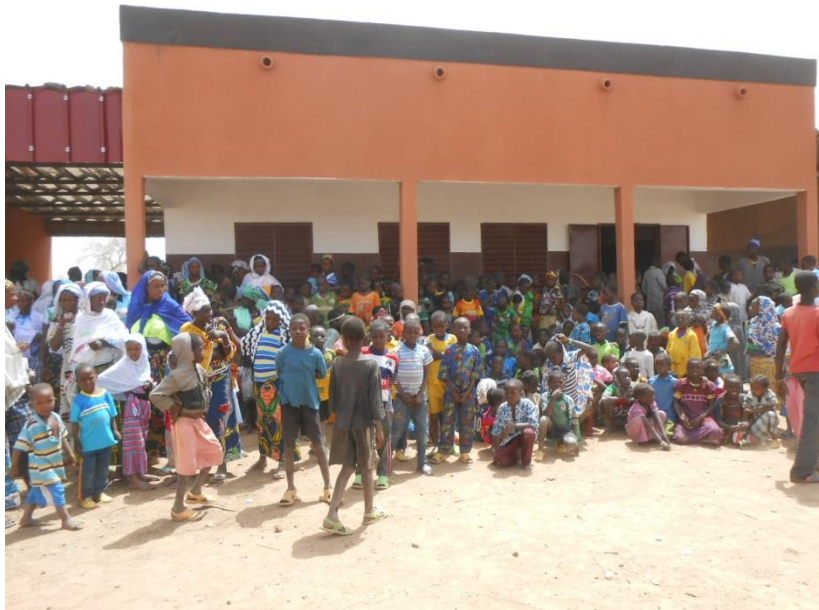
Sono contenti i bambini della terza elementare che a settembre troveranno pronta la loro quarta classe.

Con le briques in sovrappiù faremo un nuovo tentativo di difendere dalle capre i virgulti degli alberi da frutta appena piantati: proveremo a circondarli con le briques, visto che le reti metalliche non hanno tenuto.