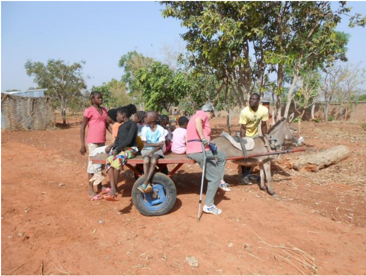
visita della fattoria. I più piccoli si sono serviti del carretto trainato dall'asino, visto che i 20 ettari della Fattoria non sono pochi!

Quella mattina la scuola elementare era chiusa perché i maestri frequentavano un corso di aggiornamento. Così abbiamo organizzato una