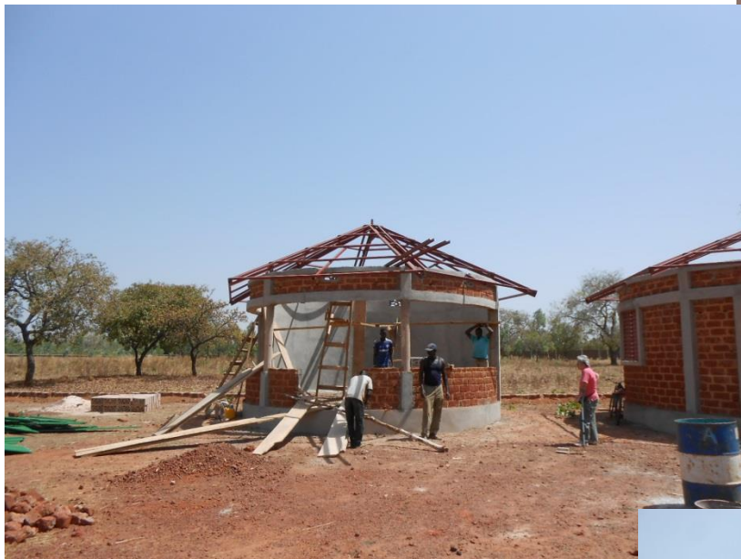
Prima tappa: la Maison des Poussins, dove i lavori vanno avanti

con criteri di sicurezza molto sommersi: si può vedere chi lavora sul tetto in ciabatte!